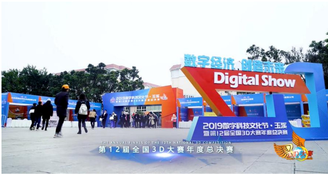
▷ 宣传片: 大赛专家说