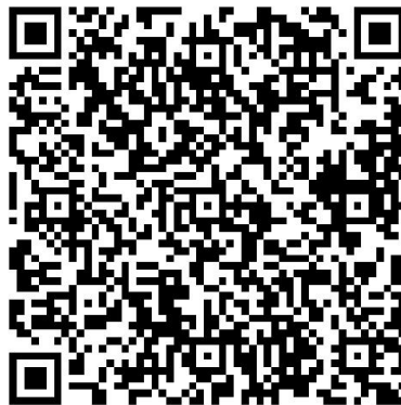
3DShow 平台控件使用教程与制作规范（视频）