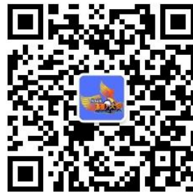
全国 3D 大赛微信公众号

全国三维数字化创新设计大赛组委会 国家制造业信息化培训中心 全国 3D 技术推广服务与教育培训联盟(3D 动力) 北京光华设计发展基金会 2024 年 9 月