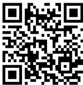
(2026年“数马&华教杯”报名及作品提交二维码)

河南赛区参赛团队须在2026年5月20日前在3D大赛“数马&华教杯”增减材复合制造及数字孪生技术创新应用大赛网页完成报名和作品提交，报名及提交作品链接： https://3dshow.3ddl.net/i/WZ-HJZC ，提交作品要求见竞赛任务书。请确保信息的准确性和完整性，以便顺利进行后续的赛事安排。