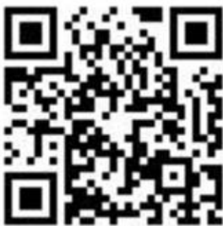
（比赛报名回执二维码）

河北赛区参赛团队须在 2026 年 6 月 30 日前在 3D 大赛“数马&华教杯”增减材复合制造及数字孪生技术创新应用大赛网页完成报名和作品提交，报名及提交作品链接： https://3dshow.3ddl.net/i/WZ-HJZC ，提交作品要求见竞赛任务书。请确保信息的准确性和完整性，以便顺利进行后续的赛事安排。并于 2026 年 6 月 30 日 18:00 前扫描以下二维码填写比赛回执。